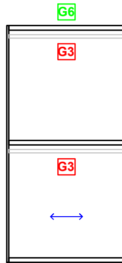
modulo ajuste grande colgado doble corto JG-A-1